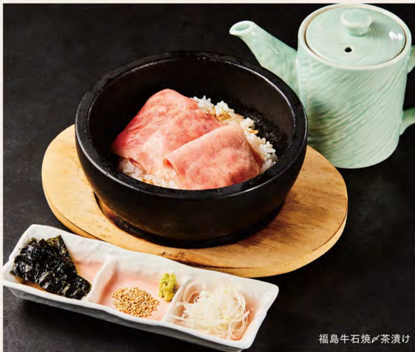
福島牛石焼茶漬け