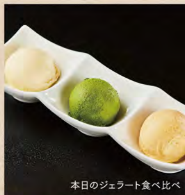
本日のジェラート食べ比べ