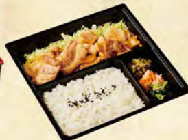
麓山高原豚 生姜焼き弁当