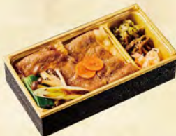
福島牛 すき焼き弁当