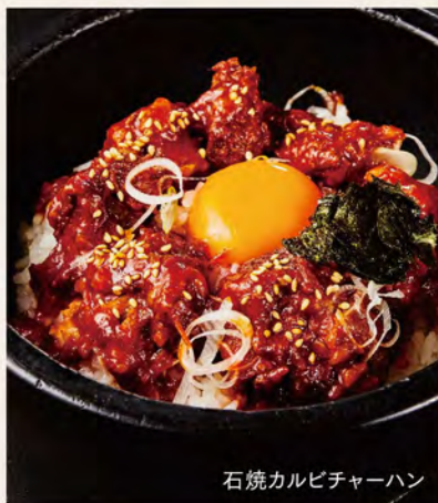
石焼カルビチャーハン