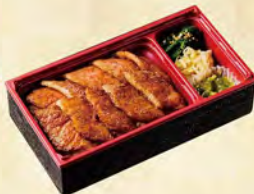
福島牛 上カルビ弁当