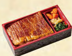
福島牛 ステーキ弁当

福島県のブランド和牛『福島牛』とブランド豚『麓山高原豚』を使用 福島県産米「こしひかり」と合わせたお弁当です